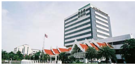
Kasetsart University (University)