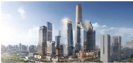
One Bangkok (Mixed-use Complex)

ตลอดระยะเวลากว่า 20 ปี หลากหลายโครงการต่างให้ความมั่นใจในผลิตภัณฑ์และบริการของเรา จนไว้วางใจให้เราติดตามดูแลระบบเครื่องสูบน้ำดับเพลิงเสมอมา ทั้งอาคารสูงและอาคารขนาดใหญ่ต่าง ๆ อาทิ คอนโดมิเนียม โรงแรม โรงพยาบาล ห้างสรรพสินค้าและศูนย์การค้า โรงงานอุตสาหกรรม ธนาคาร ตลอดจนสถานศึกษามากมาย