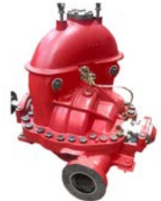
Multi-stage Multi-outlet (MSMO)