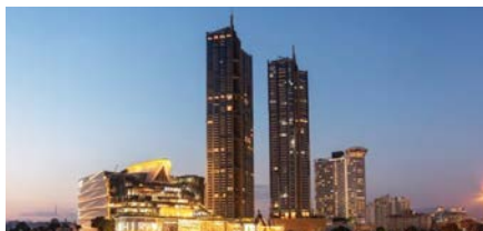
The Residences at Mandarin Oriental (Condominium)