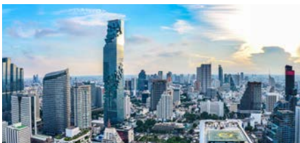
Mahanakorn Tower (Mixed-use Complex)